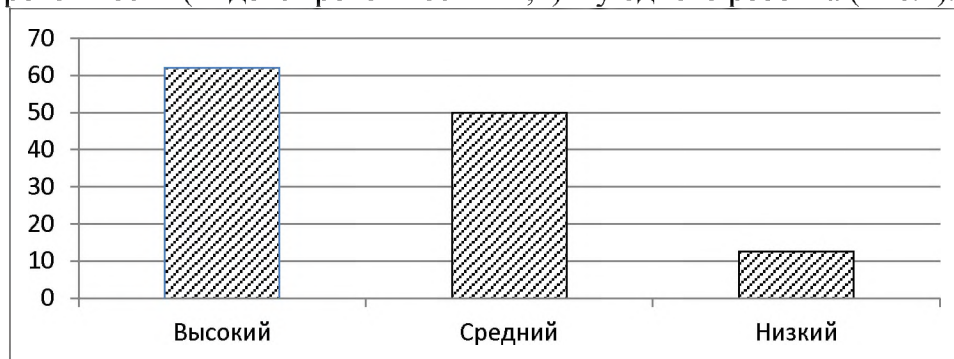
Рис. 1. Показатели уровня тревожности дошкольников с тяжелыми нарушениями слуха (по данным Теста тревожности)

Высокий уровень тревожности (индекс тревожности от 62 до 75) зарегистрирован у троих детей; средний уровень (индекс 50) – у троих детей; низкий уровень тревожности (индекс тревожности 12,5) – у одного ребенка (Рис.1).